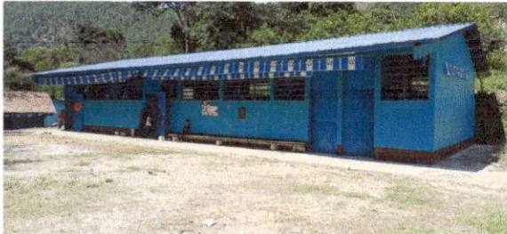
Foto1: Sustitución de lámina, por lámina troquelada aluzinc calibre 26